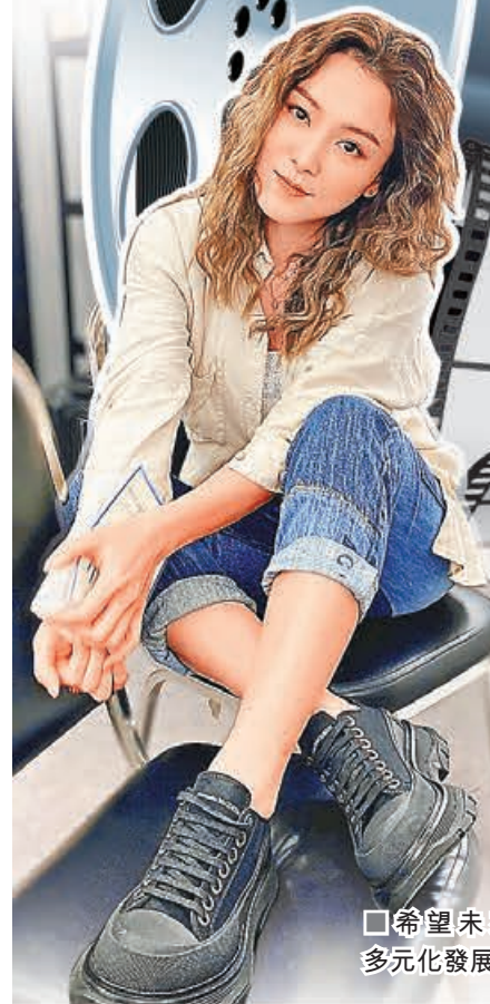
□ 希望未來有 多元化發展。