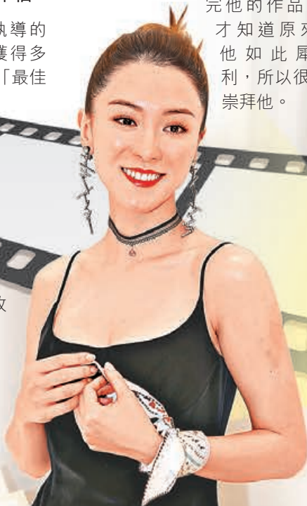
■ 冀做出成績以 匹配老公。

題，其實好辛苦，衝動說出口的話收不回來，自己難受，亦會傷害人。」對於很多情侶為籌備婚禮而吵架，她卻沒有，「因為他有主見時，我沒想法；當他沒想法時，我就有主見！而且他真的想我開心，好像我喜歡貓，但他對貓毛敏感都叫我養。」她覺得只要用心去愛人，對方一定會感受得到，亦會用心去愛你。