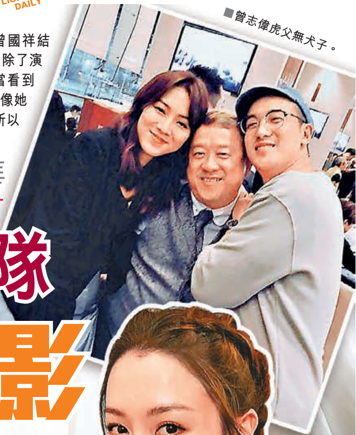
■ 曾志偉虎父無犬子。