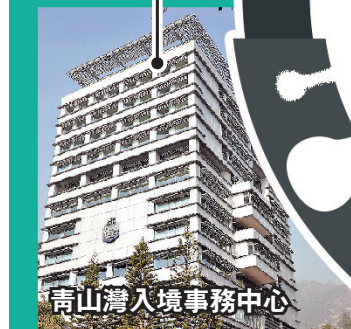
青山灣入境事務中心