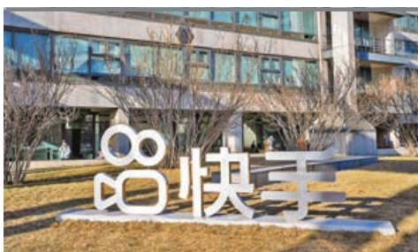
快手線上營銷服務增長佳。

期內，平均翻枱率為一天3.5次，按年下跌1.3次。顧客人均消費110.1元，同比升4.7%。