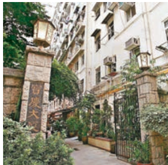
寶慶大廈有8人違反公告未檢測。

食物及衛生局發言人回覆本報指出，現時合資格人士透過網上預約系統預約接種疫苗時，須提供相關身份證明文件的號碼作登記之用，當中只包括四類證件，即香港身份證、領事團身份證、持有申請香港身份證收據，或豁免登記證明書的號碼。相關要求同樣適用於指定私家診所接種疫苗的人士。