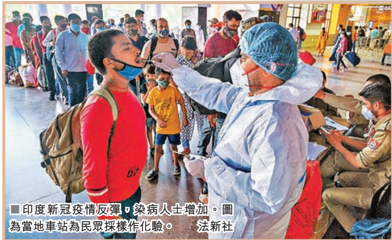
■印度新冠疫情反彈，染病人士增加。圖為當地車站為民眾採樣作化驗。