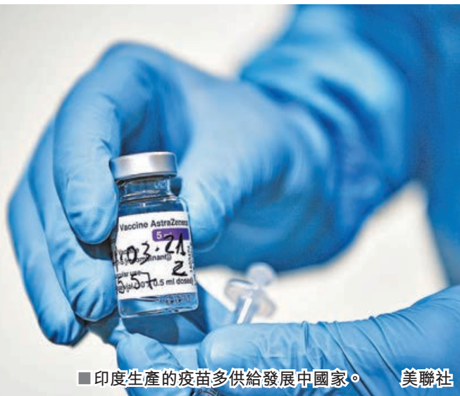
■印度生產的疫苗多供給發展中國家。