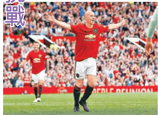
畢特貴為曼聯名宿。

另有消息指，畢特離任原因之一是和新任足球總監穆度夫溝通不足，加上費查升任技術總監而自己落空，於是一怒之下求去。