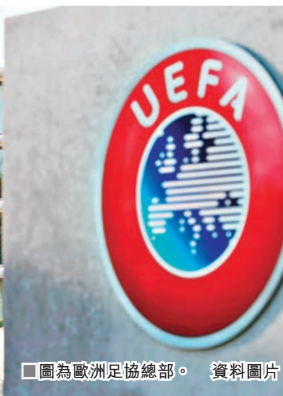
圖為歐洲足協總部。資料圖片

外媒指，一旦取消有關法案，獲得石油資本支持的PSG和曼城將是最大的受益者，他們的資金來源和支出將不受限制。PSG可以給麥巴比開出超級合約，而他們還可以給美斯一份超級合約，曼城也有能力來競爭。皇馬將很難挖到麥巴比，巴塞也很難留住美斯。