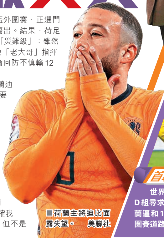
荷蘭主將迪比面露失望。