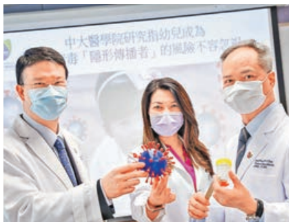
■ 中大醫學院昨公布研究結果。

中大建議政府在社區強檢和日常幼兒檢測上，為幼兒採用糞便樣本檢測，更有效地截斷隱形傳播鏈。