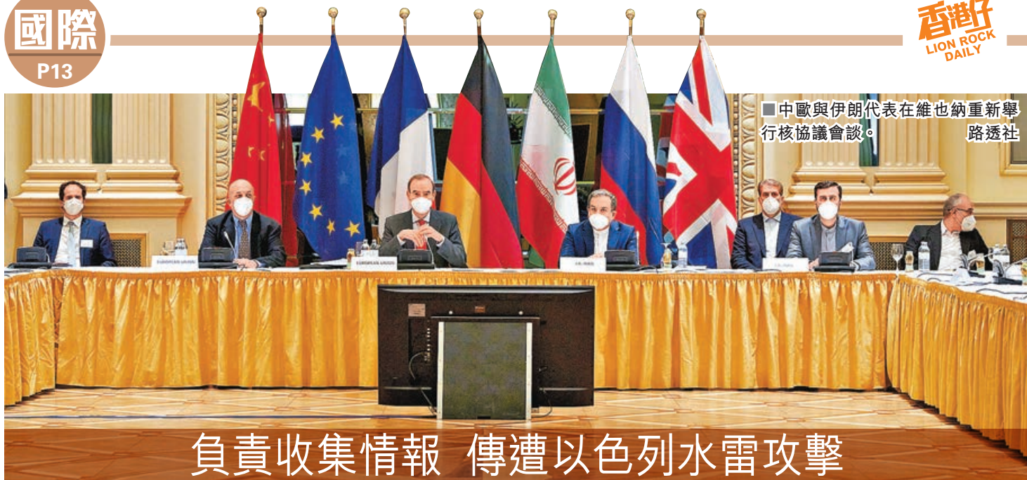
■中歐與伊朗代表在維也納重新舉行核協議會談。