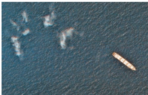
■伊朗「薩維茲號」疑遭以色列襲擊損毀。圖為該船在紅海行駛。

《紐時》引述美國官員消息稱，以色列通知美國稱，以方在紅海襲擊了「薩維茲號」，作為對伊朗近期襲擊以色列船隻的「報復」，襲擊造成船隻吃水線下方受損。報道亦指襲擊或曾被推遲，從而保證派駐中東的美國航母「艾森豪威爾號」與「薩維茲號」保持距離，事發時兩船相距