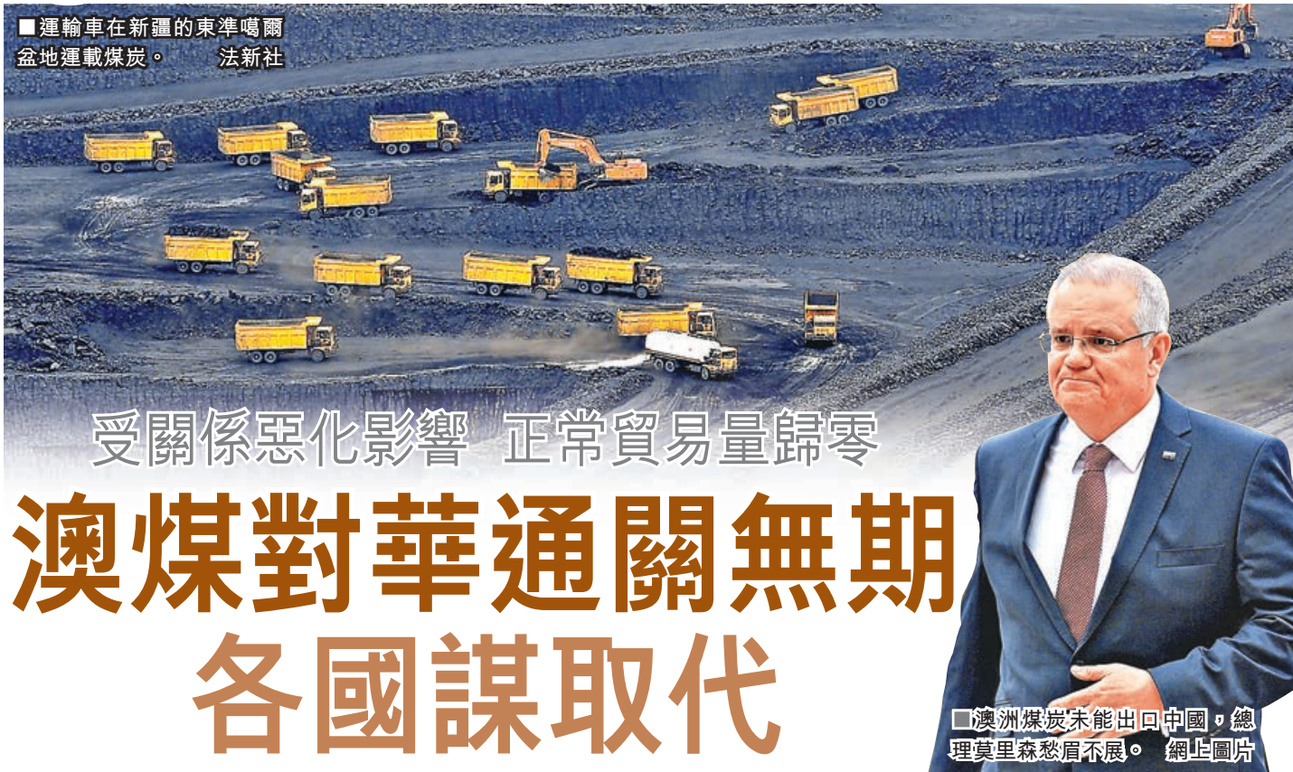
■運輸車在新疆的東準噶爾盆地運載煤炭。