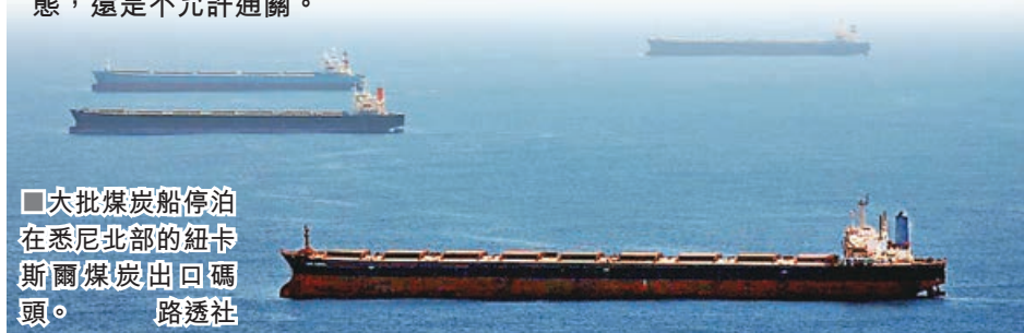
■大批煤炭船停泊在悉尼北部的紐卡斯爾煤炭出口碼頭。

2020年澳洲煤炭出口3.581億噸，比2019年同期的3.88億噸減少約3000萬噸，按年下降7.7%。2020年澳洲向中國煤炭出口7010萬噸，佔澳洲出口總量的19.6%，按年下降22.2%。且在季度上波動很大，一季度2090萬噸，按年增長23.7%；二季度2940萬噸，按年增長14.0%；三季度1560萬噸，按年下降37.3%，四季度只有410萬噸，按年陡降81.6%。