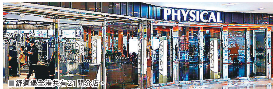
■ 舒適堡全港共有21間分店。

除舒適堡外，Future Wellness 近日亦乘勢推出「轉會優惠」，其官網fb着力宣傳道：「聽聞你玩緊間Gym已經欠租幾個月，驚佢隨時拉開唔再開？轉過嚟Future Wellness 操啦，你仲有幾多個月會籍，我哋Double送返俾(番畀)你！」該公司並推出限時240元月費優惠，免預繳，逐月收費，較正價330元平一大截。另一私人健身中心Fitness System則推出抗疫優惠計劃，小組健身計劃新客戶首堂優惠價100元，之後每堂150至250元，全程由專業教練跟進。