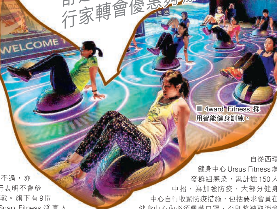
■ 4ward Fitness 採用智能健身訓練。

不過，亦有同行表明不會參加減價戰。旗下有9間分店的Snap Fitness發言人