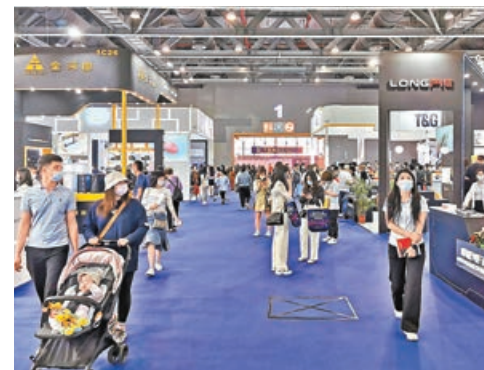
■首屆廣州國際電子及電器博覽會現場。

通過此次稽核調查發現，違規資金情況要包括個人、企業的經營貸違規用於支付購房款，消費貸款亦有用於本行住房貸款首付款現象。另外，部分空殼公司集中作為受託支付交易對手，接收多筆個人經營貸款，部分貸款資金涉嫌回流至借款人並用於購房。甚至還有房企參與其中，違規向購房客戶提供首付資金；小額貸款公司貸款用於購房認籌。