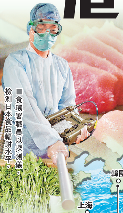
■ 食環署職員以探測儀，檢測日本食品輻射水平。

工聯會社會事務委員會昨日到日本駐港領事館請願，該會立法會議員陸頌雄關注，日本傾倒核廢水會為香港的食物安全帶來隱憂。