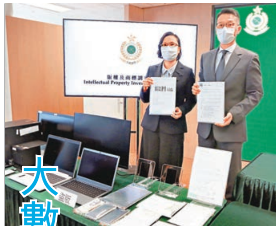
海關檢獲電腦及懷疑盜版補習教材等證物。

返海關總部作進一步調查。據悉，檢獲證物中包括「3M M40 Gas mask」軍用級防毒面具及「3M RBE-57 Filter」濾罐等。