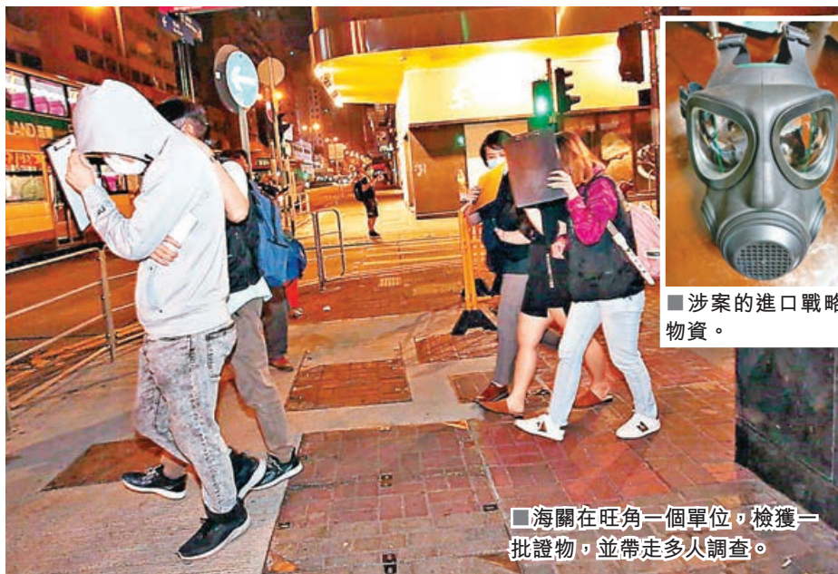
海關在旺角一個單位，檢獲一批證物，並帶走多人調查。

海關再搗破一家黑暴「港獨」物資網店。去年6月底香港國安法實施後，攬炒黑暴及「港獨」分子東竄西逃，曾在黑暴肆虐期間供應防毒面具給暴徒，更宣稱曾經「支援」佔領中文大學及理工大學暴徒的一家網店，繼續在網上和樓上舖售賣積存的黑暴物資「蟹貨」，包括進口的軍用級防毒面具等。海關聯同警方連日來展開搜捕行動，分別在旺角兩間樓上舖及馬鞍山公屋搜獲逾300件未領取有效進口許可證的戰略物品，包括133個軍用級防毒面具、175個過濾器及4個頭盔，共拘捕8名涉案男女。海關表示不排除有更多人被捕。