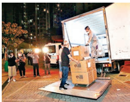
海關在馬鞍山一個住宅單位帶走多箱物品。

昨日凌晨，海關押解其中一名男子搜獲馬鞍山頌安邨頌德樓一單位，並檢獲屬受管制戰略物品的104個防毒面具及169個過濾器，屬受管制的戰略物品。行動中，人員所檢獲的逾300件受管制的戰略物品，分成20多個紙箱逐一搬上貨車運