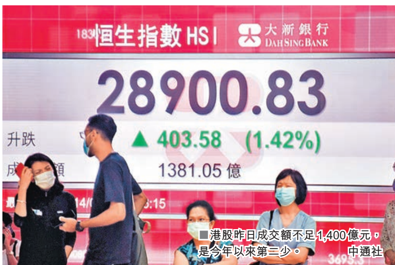
■ 港股昨日成交額不足1,400億元，是今年以來第三少。

港股跟隨外圍股市作出反彈，但是大市成交量進一步縮降至不足1,400億元，是年內的第二少全日市成交。恒指漲了400多點，回企至20日線28,664點以上來收盤。美股納指彈性出現增強，帶動高估值成長型股份作出跌後修正，其中，互聯網科技股以及汽車股，表現相對突出。