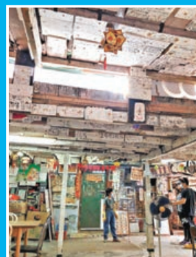
士多天花板上的發泡膠，寫滿顧客的留言。