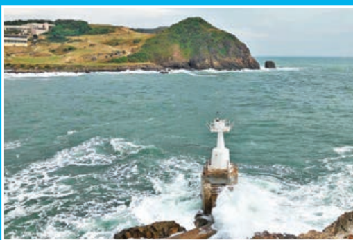
白色巨浪湧向燈塔。