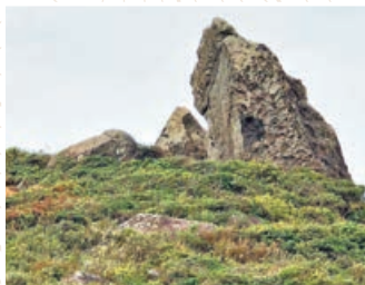
雞嶋石外形似母雞。