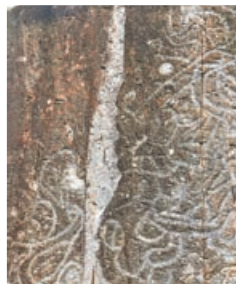
東龍島石刻已有幾千年歷史。