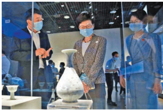
■林鄭月娥參觀博物館並體驗設備(右圖)。

資格審查委員會可以詢問參選人索取任何的資料，至於當中是否包括外國護照，稍後當局會再作了解。曾國衛補充，局方會研究在提名資料過程適當地收集相關資料。