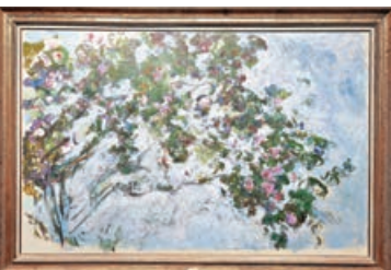
■克勞德·莫奈畫作《玫瑰》，1925年-1926年左右

畫筆的影子。阿爾伯特·勒堡曾參加過第4、第5次印象派畫展，喜愛描繪巴黎城市風景。這次展出他的兩件作品，其一是以巴黎聖母院為背景的塞納河風光，其二是巴黎著名的協和廣場，從這兩幅作品，觀眾可以欣賞到他繪畫中的印象主義氣韻。最後，莫奈的養女、後來成為他兒媳婦的布朗什·奧什代的一件作品也出現在本次展覽中。布朗什是莫奈的學生，長期追隨莫奈，是莫奈晚輩中與莫奈關係最親密的一位，她的畫風深受莫奈的影響。