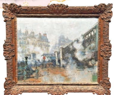
■克勞德·莫奈畫作《聖拉扎爾火車站》，1877年

得益於內地疫情防控的成功，不少如今在歐洲很難與觀眾見面的藝術珍品，遠渡重洋來到上海，令很多無法出國旅遊的藝術愛好者大呼過癮。記者在展覽現場看到，儘管188元人民幣的門票並不算便宜，但工作日的展廳內仍然爆滿。整個展覽包含了巴黎瑪摩丹莫奈博物館珍藏的61件繪畫大師真跡，其中包括莫奈的20幅傑作，涵蓋他早中年的《聖拉扎爾火車站》、《雪中列車》、《落日下的雪景》、《荷蘭的鬱金香田》、《吉維尼的黃色鳶尾花》以及晚年的《睡蓮》、《紫藤》、《玫瑰》、《日本橋》等，難得的是均為尺幅較巨大的作品。