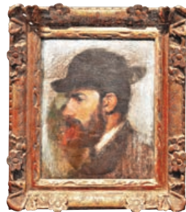
■德加畫作《亨利·胡厄畫像》，1871年