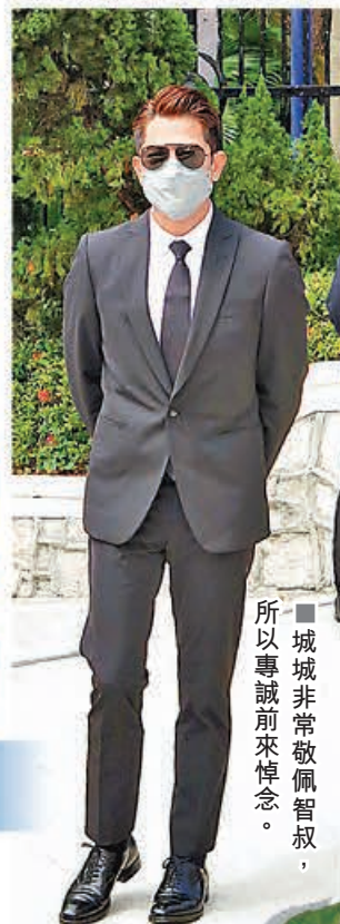
城城非常敬佩智叔，所以專誠前來悼念。