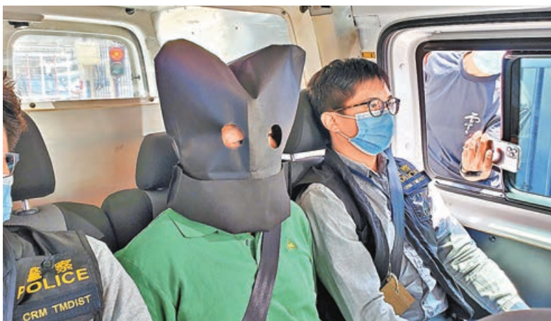
一名無業男子涉冒警詐騙被警方拘捕。

其中一宗涉及一名住山頂豪宅的九旬老婦，自去年8月起被冒充「內地公安」的電話騙徒接連詐騙，累計騙走2.5億元巨款，直至今年3月2日受害女女兒揭發事件始報案，成為歷年涉款最高的假冒內地官員電騙案件。