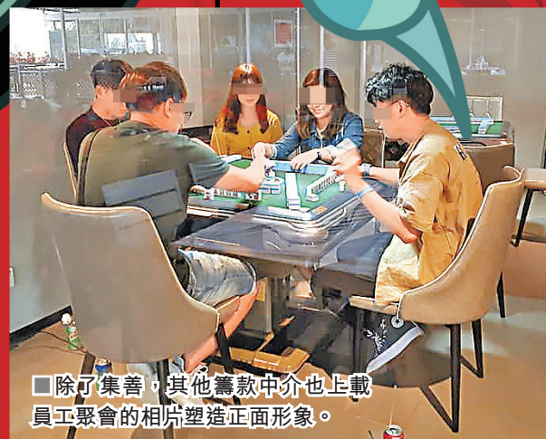
除了集善，其他籌款中介也上載員工聚會的相片塑造正面形象。