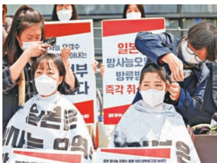
韓國一群女大學生在日本大使館前削髮，抗議東京政府無法無天。