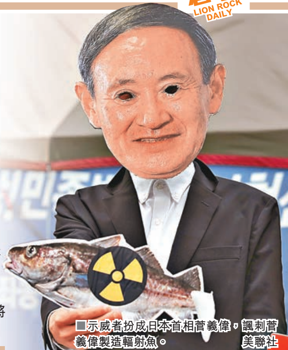
示威者扮成日本首相菅義偉，諷刺菅義偉製造輻射魚。

日本政府決定2年後（即2022年）將福島第一核電站的核污水排入海洋，並稱核污水經過稀釋，不會對環境及人體有影響，遭到各國強烈批評，而事件在日本國內同樣有強烈反應，原本準備擴大作業的福島漁民們有了放棄漁業的念頭。他們表示「福島的海曾是一個什麼都能捕到的寶庫，將來再也沒有這樣的海了。」