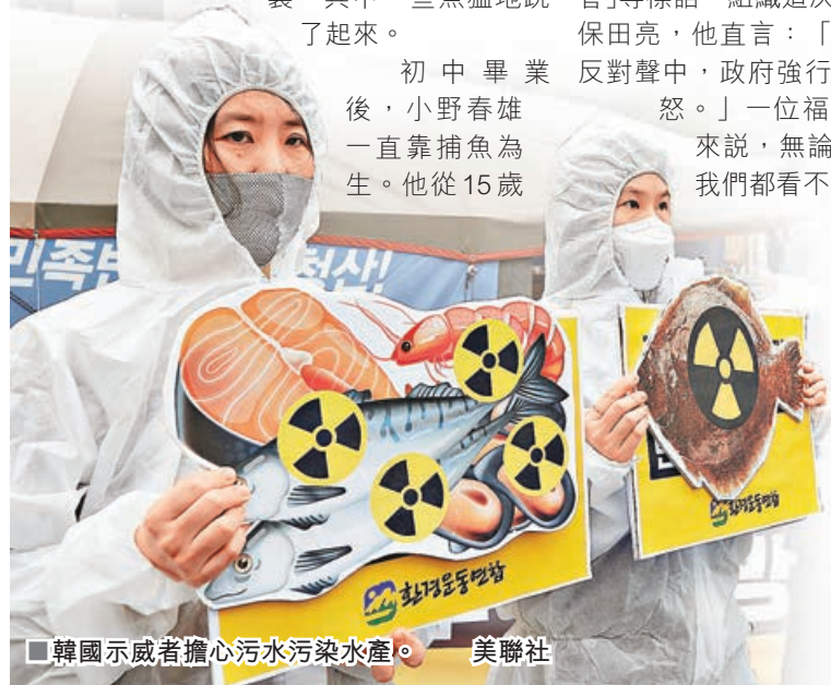
韓國示威者擔心污水污染水產。