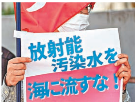
日本民眾舉牌反對日本政府的決定。

因放射性物質超標，福島縣海域的黑鮪19日起被禁止上市。這緣於4月1日在福島縣海域捕撈的一條黑鮪體內被檢測出270貝克勒爾放射性物質銫，超出標準值。這是近兩年來首次發現魚超標，也打破了日本政府自2020年2月起全面解除福島海產品上市限制的決定。福島的漁業正面臨後繼無人的局面——這裏漁民的平均年齡在60歲左右，越來越多的年輕人正遠離漁業。而今，年邁的漁民們也只能考慮「上岸」了。「即使淨化後的水仍然殘留着其他放射性物質，怎麼稀釋都會讓人心裏不舒服的。」「那就不幹了。污水排放的同時會給些經濟補償吧。」老漁民們如此嘆息。