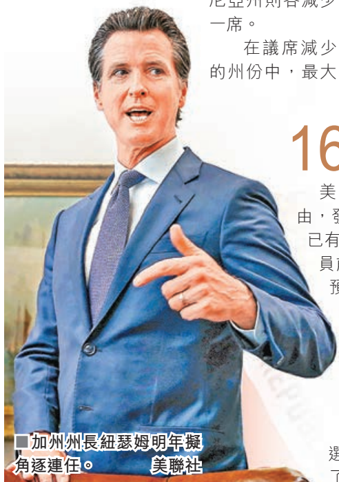
加州州長紐瑟姆明年擬角逐連任。