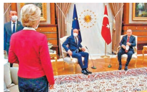
馮德萊恩（左）會晤埃爾多安（右）時，未獲安排座位。

歐洲理事會主席米歇爾也對此感到歉意，他稱當時他想離席讓座，但他擔心會引發更廣泛的外交衝突，特別是考慮到土耳其與歐盟之間的緊張關係。