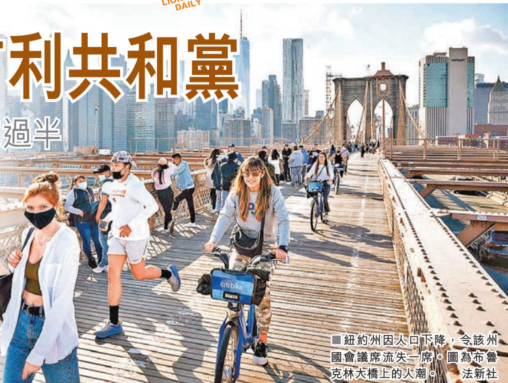
紐約州因人口下降，令該州國會議席流失一席。圖為布魯克林大橋上的人潮。

民主黨全國選區劃分委員會執行主任博爾頓便指出，藍州人口正向紅州流動，隨着拉丁裔、非裔和市郊人口增長，民主黨仍有望可將部分紅州變藍。