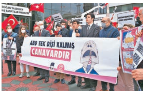
土耳其民眾在美國大使館外示威，抗議拜登承認亞美尼亞大屠殺的言論。

亞美尼亞認為遇害人數多達150萬，是「大屠殺」；土方認為那些亞美尼亞人死於內戰，死亡人數被誇大。本月24日，美國總統拜登將上述事件認定為「種族滅絕」。