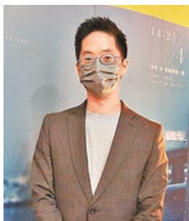
■林丰負責聲境創作。