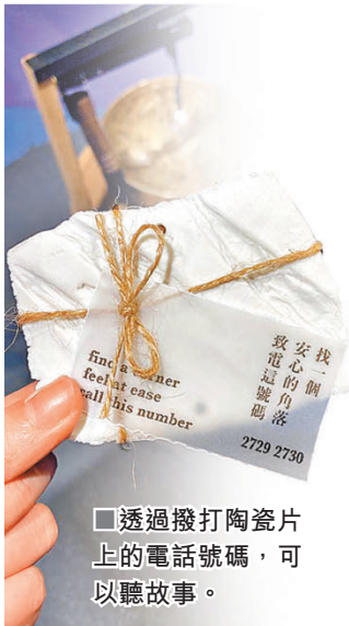
■透過撥打陶瓷片上的電話號碼，可以聽故事。

“ 這次聲境創作中，混合了音樂、自然界的聲音、城市的聲音，配上頌鉢裝置，現場呈現一種輕柔和緩的音波流轉，令人進入平靜沉思的狀態。 ”