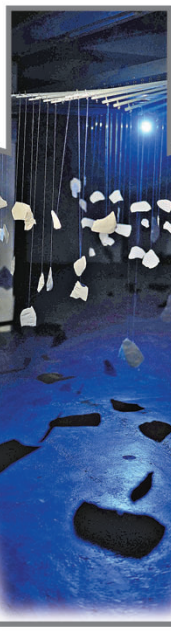
■陶瓷碎片碰撞發出清脆聲響。