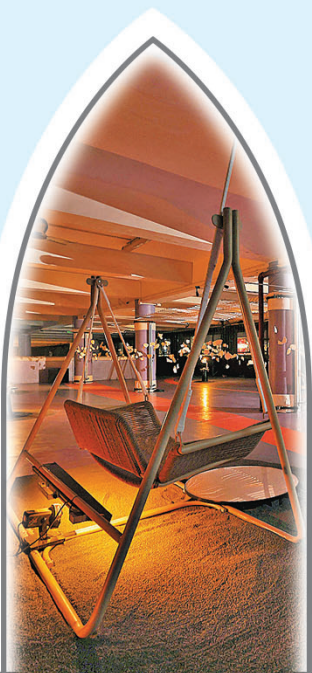
■以光影增強展場視覺效果。