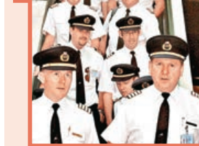
■ 疫情下，國泰航班大減，高薪一族的機師成為公司沉重開支。