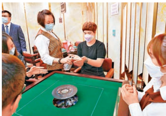
■ 客人在打麻雀前，職員都會為客人噴灑消毒藥水，清潔雙手。