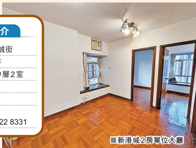
新港城2房單位大廳