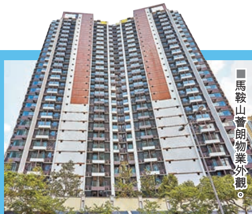
馬鞍山蒼朗物業外觀。

蒼朗鄰近區內老牌大型屋苑新港城，而且離馬鐵馬鞍山站不遠，屋苑附近亦有多條巴士線，往來沙田市中心以及過海至港島，交通十分方便。