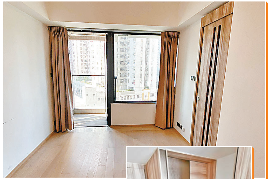
開放式單位客飯廳