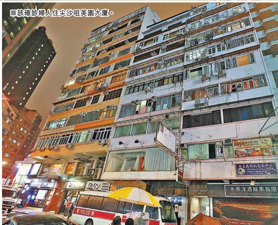
所有住戶撤離檢疫21日。