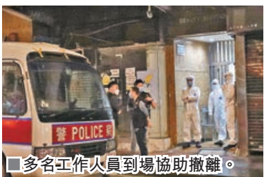
多名工作人員到場協助撤離。

他又說，檢疫酒店設計不同於醫院，走廊設計缺乏通風，無法過濾病毒，因此同酒店內的檢疫人士容易互相傳播，建議增加酒店檢疫人士的病毒檢測次數，在檢疫首周進行多一次檢測，從「上游」阻止病毒流入社區。