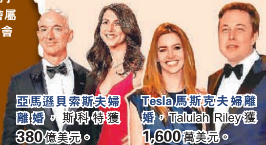
亞馬遜貝索斯夫婦離婚，斯科特獲380億美元。