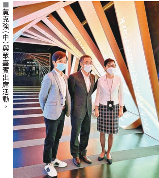
黃克強(中)與眾嘉賓出席活動。

香港科技園公司創科體驗館昨日開幕，場館面積約370平方米，設有7個展區，涵蓋生物醫藥科技、人工智能(AI)、金融科技及智慧城市四個領域，30多項互動展品將視覺藝術與數碼科技有機融合，讓訪客親身感受香港作為大灣區創科樞紐的領先水平及潛力。科技園行政總裁黃克強表示，展館主要面向科學園訪客，暫不對公眾開放，園區內初創企業可以利用這一空間更好地向合作方講解香港創科產業。