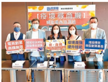
民建聯籌備開辦婦女電商培訓班。

疫情下市民出行受阻，加速消費習慣網絡化的轉變，直播帶貨、電子商貿等的營銷模式在香港引起熱潮，成為為數不多逆市興旺的行業。民建聯婦女事務委員會為幫助婦女在疫境下開拓新商機，計劃於六七月舉辦「網·商機」婦女電商培訓班，在全港招收100位30歲以上的女學員，通過7堂ZOOM網上課程，教授學員如何利用社交媒體創業、開設facebook商店、構思內容等，加強就業競爭力。有興趣的市民可於本月底前