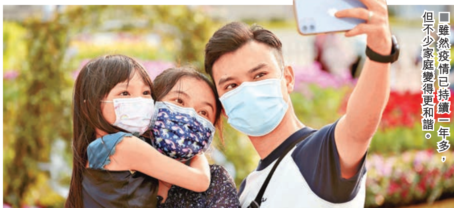
雖然疫情已持續一年多，但不少家庭變得更加和諧。

雖然疫情已持續了一年多，但有組織調查發現，今年港人的家庭開心指數較2019年有所回升，其中以25歲至34歲母親的家庭開心指數最高，在愛意表達上也更為順暢。不過，仍有一成家庭較不開心，組織建議子女在即將到來的母親節，向媽媽獻上心意卡，積極表達對家人的愛意。