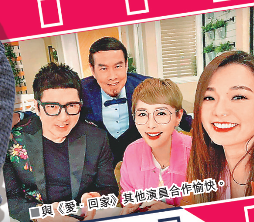
■與《愛·回家》其他演員合作愉快。

如今，白彪當然是名副其實的「戲骨」，但他並不認為自己是十分有天賦的演員，「演戲最重要的還是經歷、經驗，除了有做戲的經驗、對鏡頭的表達之外，在生活中的體驗也是十分重要的。」他認為生活中發生的事情，必須要留下思考和感受，而那種直觀的投射在表演中是最大程度的加分。儘管自己是第一代「靖哥哥」，但他仍希望在表演，尤其是電影市場上能有自己的代表作，「我對表演這件事仍然是有期待的，現在每天做運動，希望保持好的狀態，迎接更好的角色。（永不言休？）現在的心情是半退休狀態，有工作就當同班朋友交流、見面，退休會好辛苦，人會頹好多。」