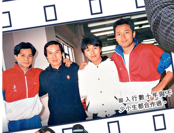
■入行數十年與不少小生都合作過。