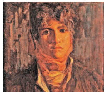
胡振宇《弗拉蒙少女》