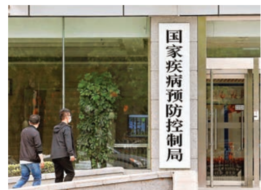
中國國家疾病預防控制中心位於北京市海澱區知春路14號，昨日正式掛牌。

在應對新冠疫情過程中，中國公共衛生體系發揮出巨大作用，但仍暴露出很多問題。鍾南山院士此前談及國家疾控中心成立時表示，新冠肺炎疫情暴露出中國公共衛生系統的一些不足，突發性事件逐級匯報機制繁瑣，容易耽誤時機，國家疾控局的成立將補齊這一短板。他希望國家疾控中心未來能夠做到兩件事，一是能夠將被判斷為「突發性事件」的緊急狀況直接上報給國家，節省因層層匯報而產生的時間成本。二是對一些行政部門進行監督，盡可能避免誤判發生。