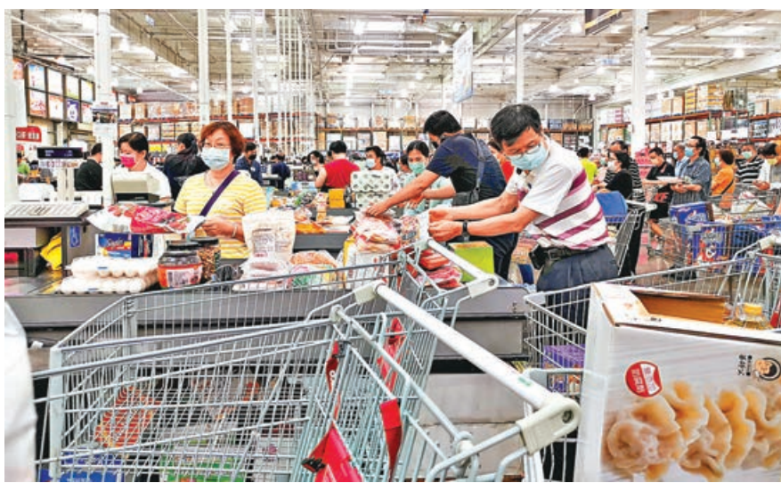
到超市搶購日用品。台灣新冠疫情升溫令人心惶惶，大批民眾昨日湧

因台當局缺乏規劃，全新冠疫疫苗注射率至今不足1%。然而，台灣連日來本土疫情擴大，也激起了更多民眾打疫苗的意願，疫苗預約日期已排到了6月。由於民進黨當局此前「孤注一擲」，至今只取得約30萬劑阿斯利康疫苗，目前只剩不到20萬劑。蔡英文不斷強調的本土出產疫苗，尚在二期臨床階段。台灣衛福事務部門負責人陳時中一句「現擔心疫苗不夠打」，讓台灣民眾心惶惶，擔憂後續疫苗供應難保障。