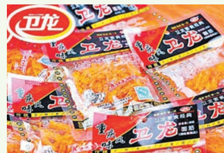
衛龍上市前已引入騰訊等基投。