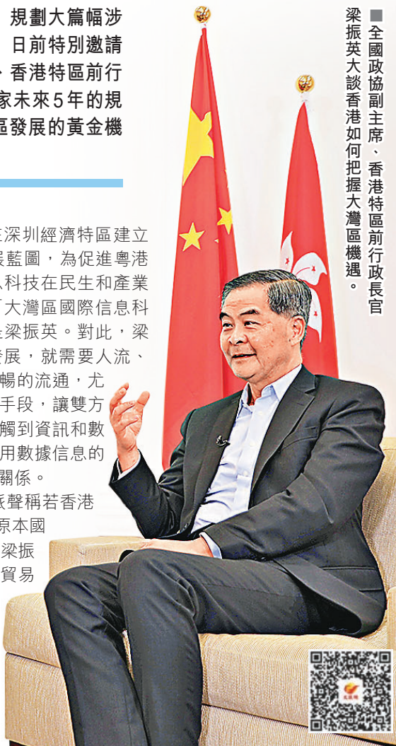
■全國政協副主席、香港特區前行政長官梁振英大談香港如何把握大灣區機遇。

馮煒光問道，「但攬炒派聲稱若香港未來要依靠內地，將會失去原本國際化的特色，這是事實嗎？」梁振英表示，內地是香港最大的貿易夥伴，很多內地遊客會來香港旅遊，同時也有很多香港人去內地讀書和養老，兩地社會已經發展到「你中有我，我中有你」的情況。