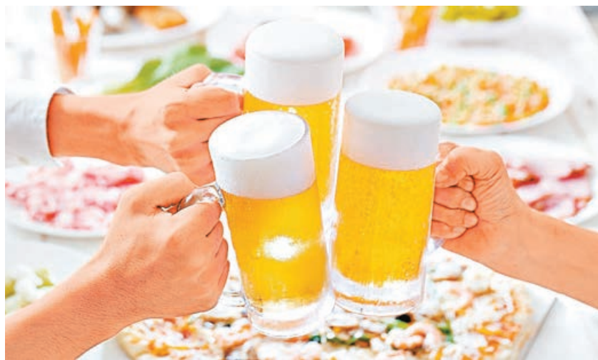
在通脹背景下，啤酒和紙業存在提價空間，啤酒股近期更備受追捧。

港股於假期前(周二)走了一波三連漲，恒指再漲了400點，進一步回企至10日線28,304點以上來收盤，但是在佛誕假期前夕，大市成交量下降至僅有1,300多億元。目前，港股的短期跌勢是有所回穩了，中美近期公布的經濟數據都出現了增速放慢，市場憧憬寬鬆政策仍將持續，估計是帶動股市展現跌後反彈的原因。