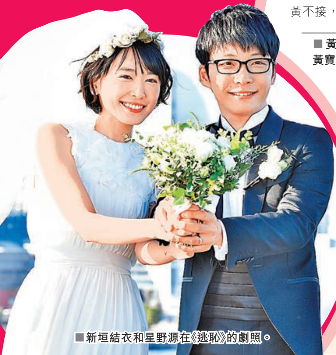
新垣結衣和星野源在《逃恥》的劇照。