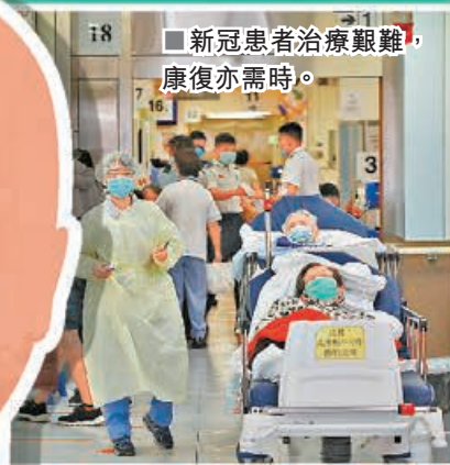
新冠患者治療艱難，康復亦需時。