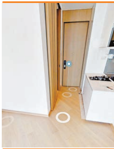
單位大門及開放式廚房