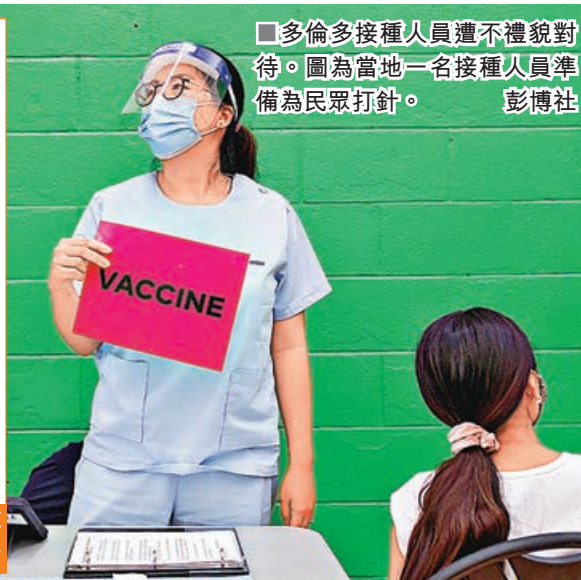
■多倫多接種人員遭不禮貌對待。圖為當地一名接種人員準備為民眾打針。