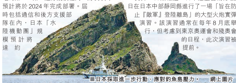
■日本採取進一步行動，應對釣魚島壓力。 網上圖片

另外，日媒報道，日本陸上自衛隊22日在日本中部靜岡縣進行了一場「旨在防止『敵軍』登陸離島」的大型火炮實彈演習。該演習通常在每年8月底舉行，但考慮到東京奧運會和殘奧會