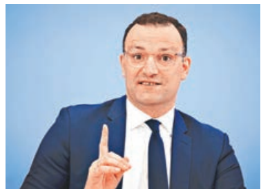
■衛生部長施潘早前宣布，下月7日起為所有民眾打針。

德國的接種計劃因疫苗供應趨向穩定步上正軌，隨着政府宣布會為完成接種人士放寬防疫限制，近日預約打針人數急增，很多尚未合資格接種的年輕人都紛紛致電診所預約，又或到接種中心排隊，甚至各出奇招嘗試插隊打針，讓向來重視「守秩序」的德國人出現罕見一面。