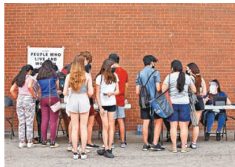
■加國民眾接種意欲踴躍。圖為一個接種中心外民眾排隊登記打針。

在安省，許多通過臨時注射中心或藥房接種疫苗的居民，未能預約接種第2劑疫苗，省府建議他們聯繫接種首劑疫苗的機構獲取最新信息。