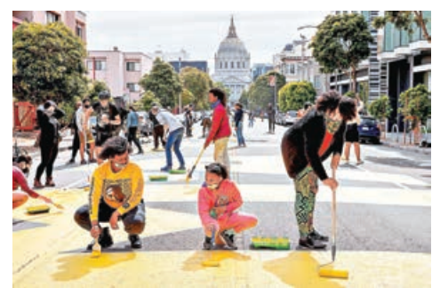
■美國民眾舉辦紀念活動，為地上「BLM」重新上色。

顯美國過往最黑暗的警察、貧窮等種族歷史，不過如普林斯頓大學的美國非裔族群學者格洛德所形容，不少黑人其實感覺自己被不同非裔死亡的案件、種族歧視的政策等新聞所「淹沒」，感覺無論黑人做什麼，白人和美國這個國家都永不改變。