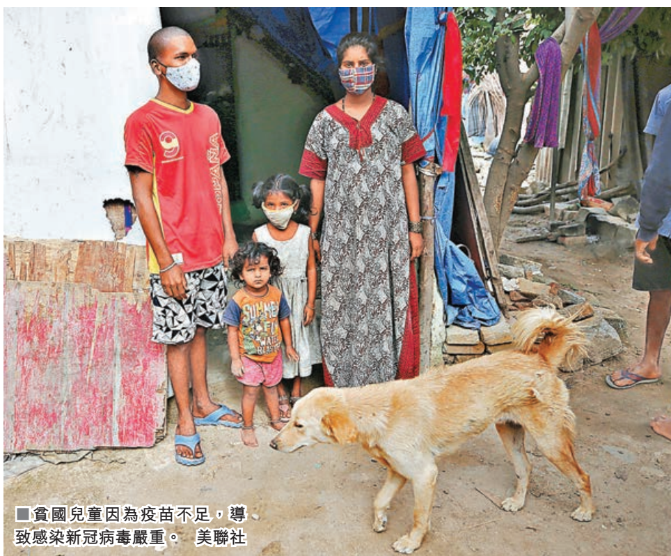
■貧國兒童因為疫苗不足，導致感染新冠病毒嚴重。

在印度，馬哈拉施特拉邦過去一個月錄得7.5萬宗兒童確診，較上月增加近51%。卡納塔克邦在4月至5月錄得的不滿9歲兒童個案，相當於1至3月的1.4倍，在10歲至19歲確診個案，更是1.6倍。班加羅爾小兒肺科醫師斯里坎塔反映，當地現在每天可錄得約15宗兒童確診，較上一波