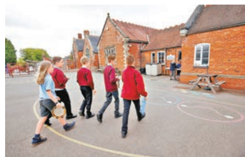
■英國校園傳印度變種病毒擴散，威脅學生安全。

另外，美國疾病控制與預防中心（CDC）前日表示，正在調查少數年輕人完成接種兩劑新冠疫苗後出現心肌炎個案。CDC稱，個案主要在接種第二劑輝瑞/BioNTech或Moderna（莫德納）疫苗約4天後出現病徵，目前暫未確認有證據表明疫苗與心肌炎有關。