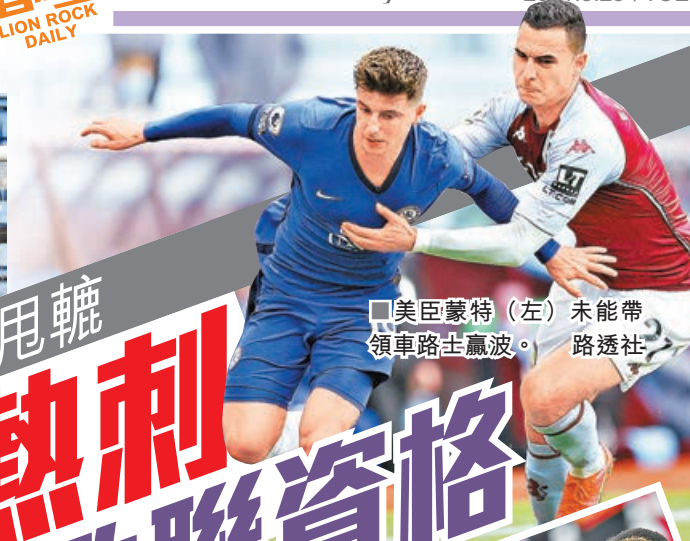
美臣蒙特(左)未能帶領車路士贏波。