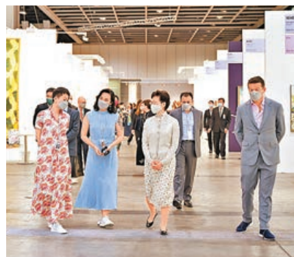
■行政長官林鄭月娥(左三)到灣仔香港會議展覽中心參觀第九屆巴塞爾藝術展香港展會。