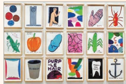
■David Shrigley 的作品

David Shrigley 展位：Stephen Friedman Gallery