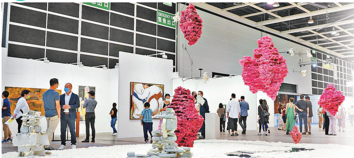
■陸浩明大型裝置作品《產物，殘物》展於展廳中央。