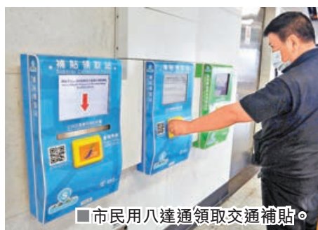
市民用八達通領取交通補貼。

另外，由於使用自動駕駛車輛的需求將持續增加，政府建議設立具彈性的新規管框架，以應對自動駕駛車輛科技的演變及確保公眾安全。張仁良表示，委員支持政府的建議，認為有助自動駕駛車輛科技