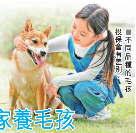
不同品種的毛孩投保會有差別。

主人們在為毛孩購買保險前，也真的要貨比三家，權衡利弊，了解哪一種產品最適合自家寵物，才可以買到最大程度的「安心」產品。