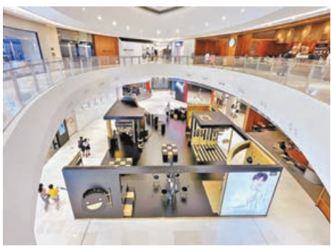
■29日，天河路商圈的天環廣場中庭，只有零星的顧客在逛街。