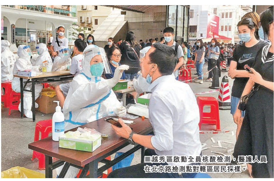
■越秀區啟動全員核酸檢測，醫護人員在北京路檢測點對轄區居民採樣。

棋」，調動三級醫療機構支援廣州和佛山。30日，最大規模支援隊伍出征活動在廣州各大醫院舉行。