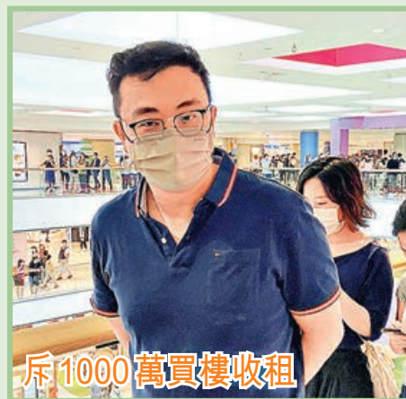
斥 1000 萬買樓收租

來自外區的方先生和黃小姐表示，柏傲莊 III 價錢合理，地點更具優勢，畢竟是鐵路上蓋項目。他們會留意一房和兩房單位，暫時尚未決定買來自住或是投資。他們亦計劃透過按揭保險計劃買入，認為香港買「磚頭」始終最具升值潛力。