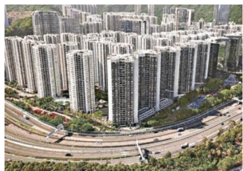
太古城 5 月錄得 50 宗二手成交，為 2013 年初以來單月最多。

另外，美聯物業吳肇基表示，鯉魚涌太古城 5 月迄今錄得 50 宗成交，按統計，為 2013 年 3 月份後八年來單月最多，交投暢旺，亦反映太古城仍是二手樓市重要指標。