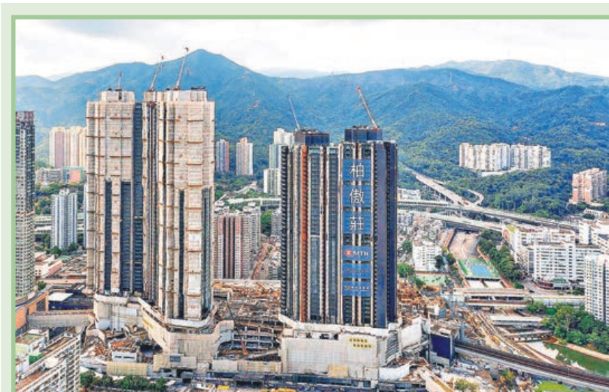
大圍站柏傲莊 III 最快周六進行首輪銷售，推售單位預計三百伙。

鴨洲逸南昨日作首輪開賣 45 伙，早前截收逾 530 伙認購登記。該 45 伙面積