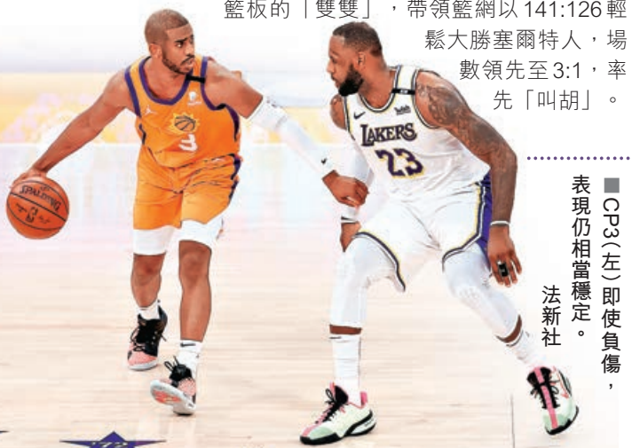
■CP3(左)即使負傷，表現仍相當穩定。

另邊廂，籃網的艾榮發威，罰球11射全中，拿下39分11籃板的「雙雙」，帶領籃網以141:126輕鬆大勝塞爾特人，場數領先至3:1，率先「叫胡」。