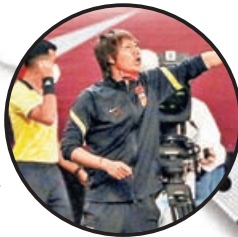
■國家隊主帥李鐵對球員表現感滿意。

日前以7:0大破關島的國足，由於之後分組賽對手包括馬爾代夫及敘利亞均有多人感染新冠肺炎，未獲准入境，經與亞洲足協協調後，決定將餘下3輪分組賽主場賽事全數移師至迪拜中立場舉行。國足大軍最快明日出發，爭逐出線阻礙重重。