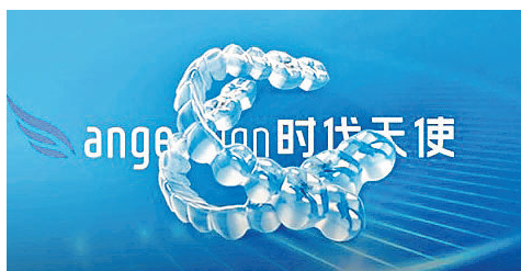
■時代天使估值逾370億元。

恒指上方阻力處於29,500點，下方支持位則在27,500點左右，是一個大型上落區，不少投資者均在這水平獲利出貨。