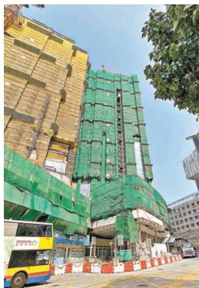
■ 於上月推售的黃竹坑站晉環戶戶千萬，並未窒礙捧場客熱情。

至於新界區月內以餘貨項目銷售為主，以致5月一手私宅登記只有547宗，較4月的520宗只微升5%，為全港三區之中升幅最少者。至於登記金額按月相應微升3%，錄得69.88億元。