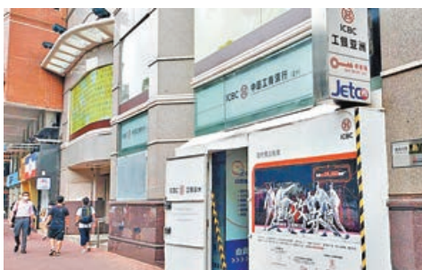
■ 尖沙咀鐵路大廈地面商舖，盡入佳明集團。

佳明集團(1271)昨日宣布，向已故鄧成波家族購入尖沙咀漆咸道南39號鐵路大廈地面B舖，作價2.068億元。連同毗鄰商舖(現為「明翹匯」之售樓處)，佳明集團現時全數擁有鐵路大廈地面商舖業權。