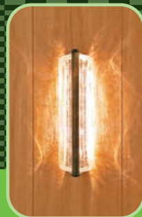
燈光投影在牆壁周圍