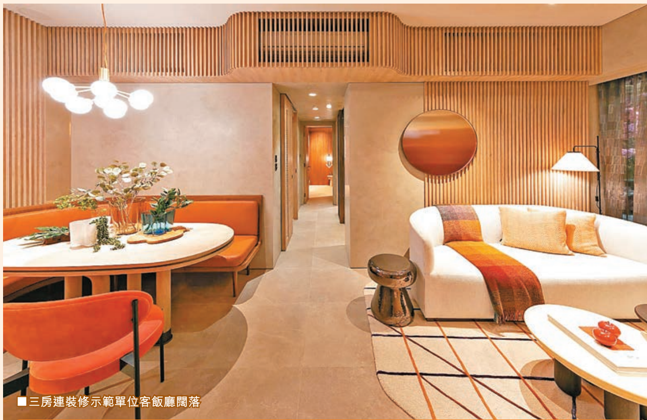
■三房連裝修示範單位客廳闊落