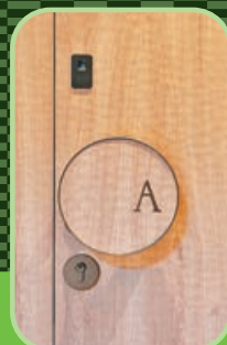
A單位大門設計獨特