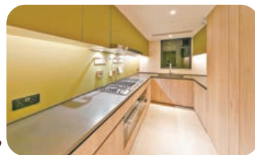
■廚房長方形設計寬敞