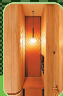
大門旁邊優雅裝飾燈